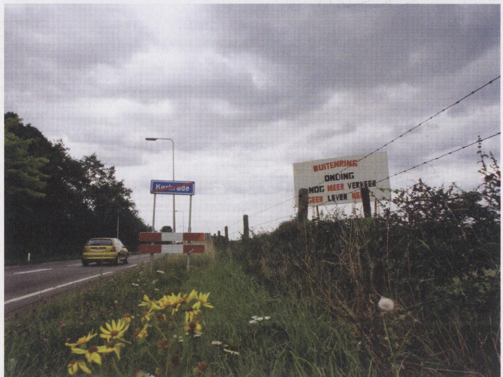
De Milieufederatie steunt het verzet tegen de aanleg van de Buitenring Parkstad